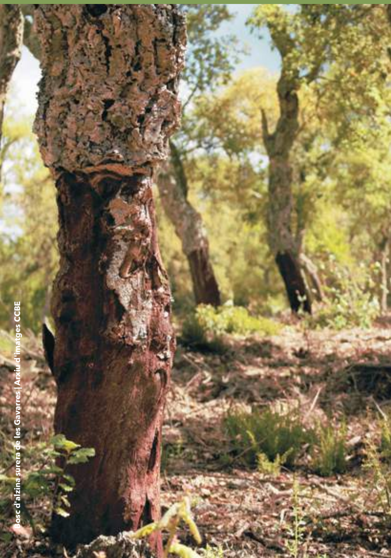
Josep d'Alzina sureta de les Gavarres