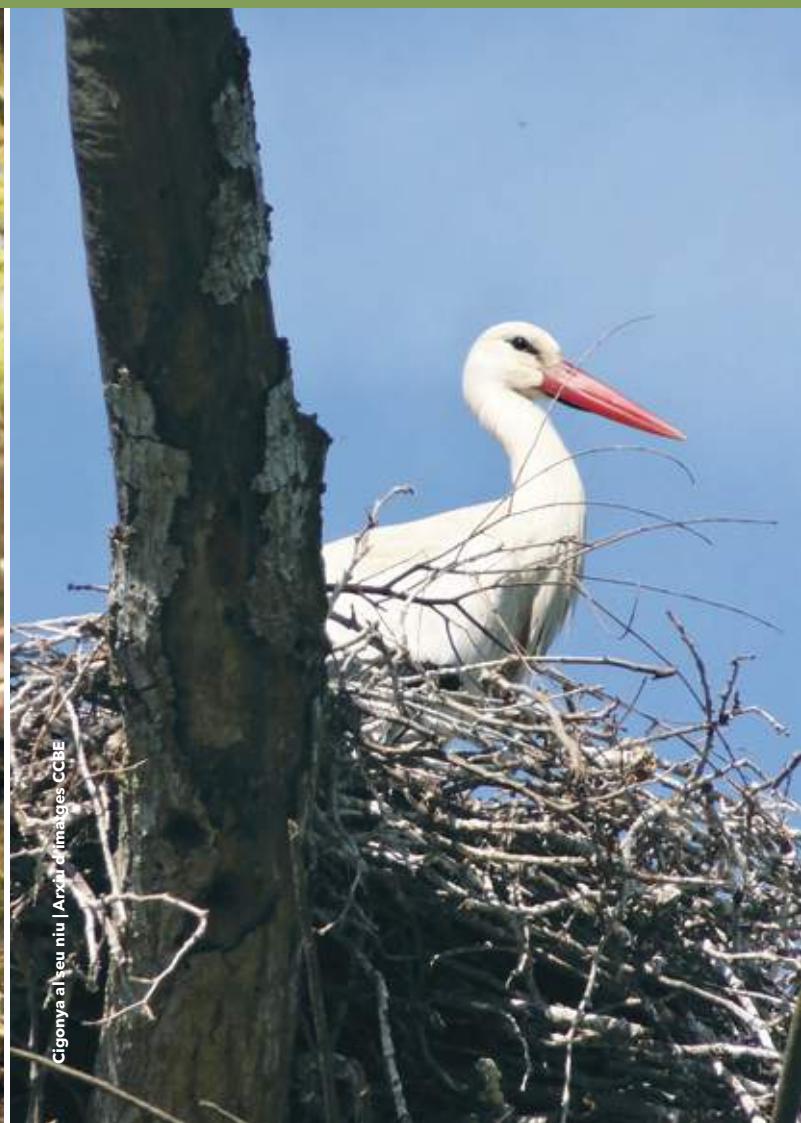
Cigonya al seu niu