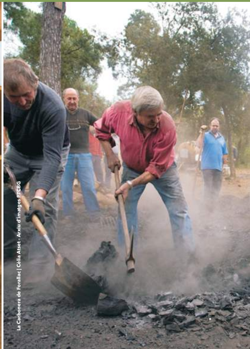
La Carbonera de Forallac