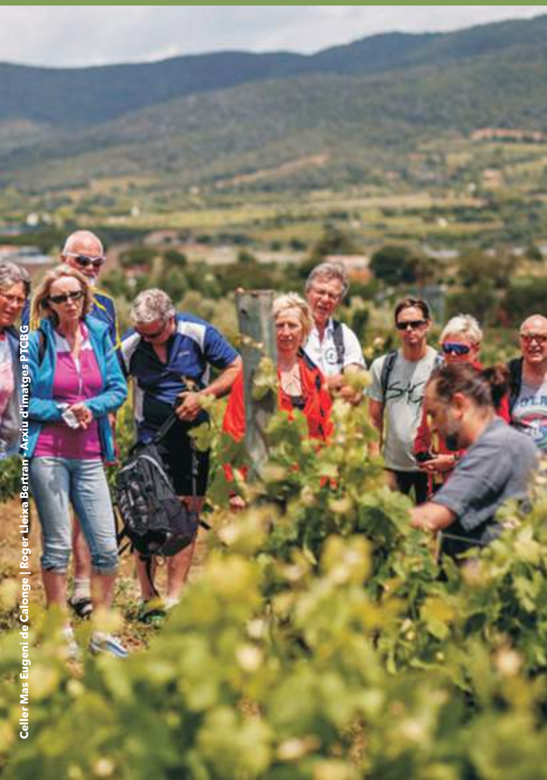
Celler Mas Eugeni de Calonge | Roger Lleixa Bertran - Arxiu d'imatges PTCBG