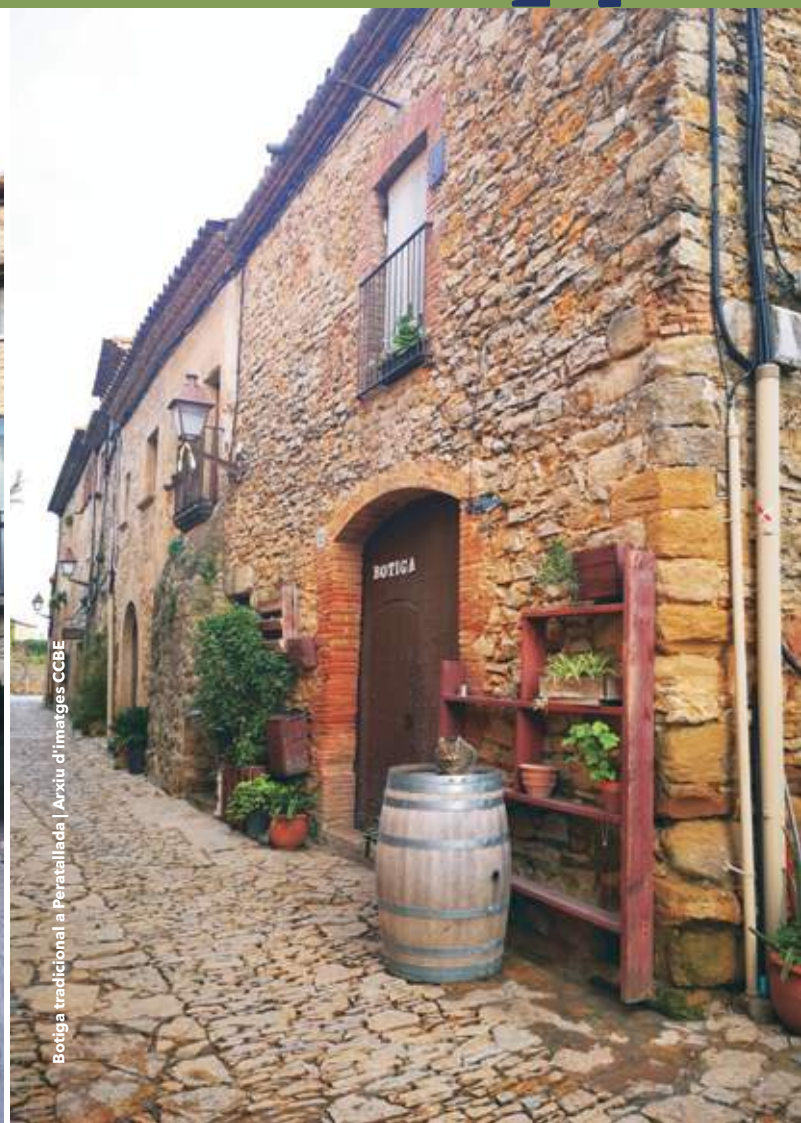
Botiga tradicional a Peratallada