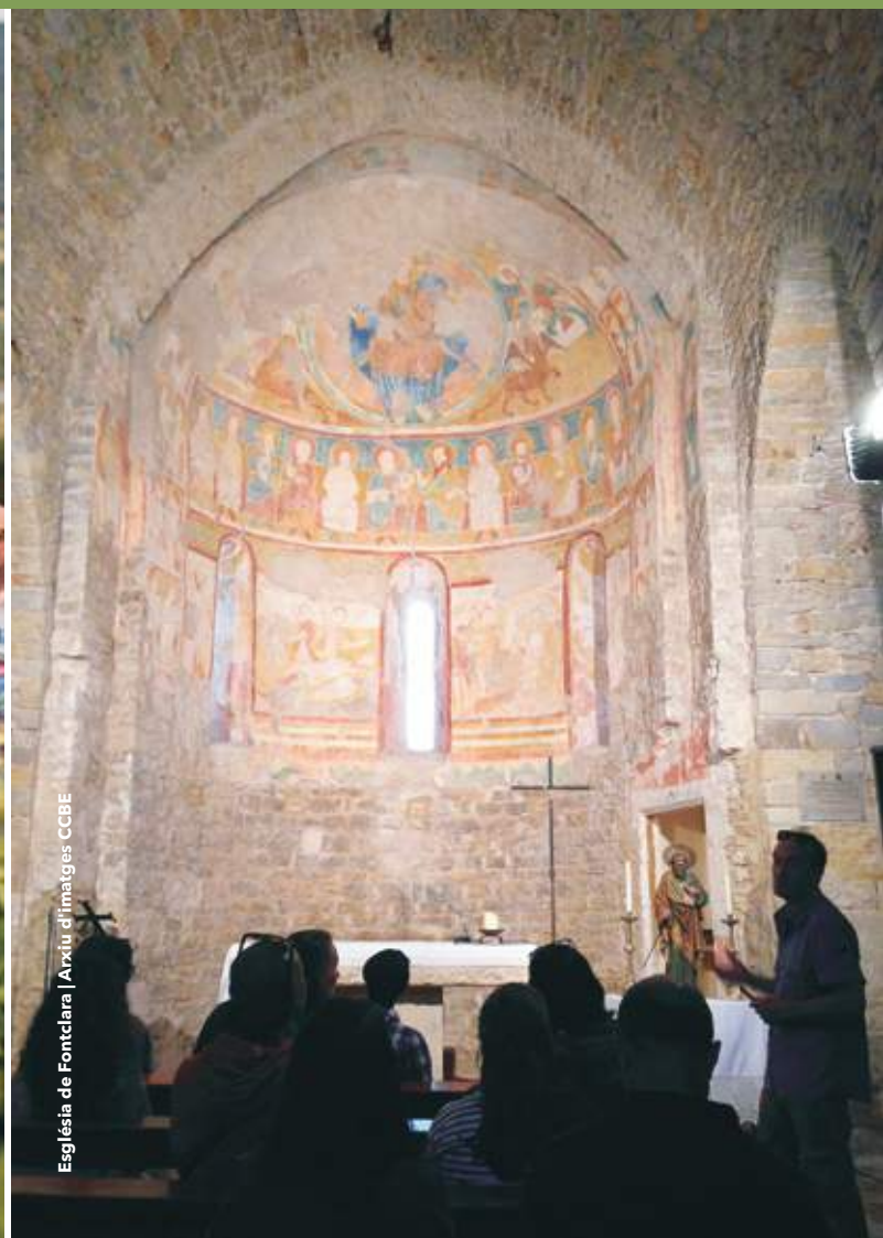
Església de Fontclara