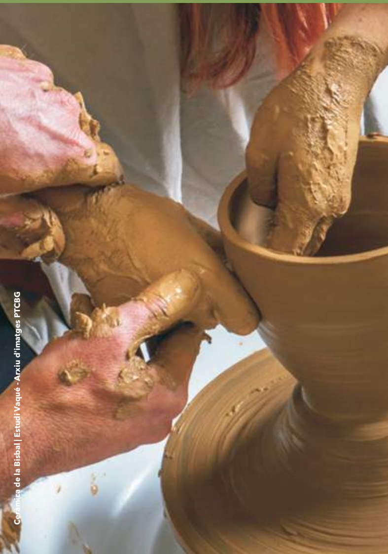
Ceràmica de la Bisbal