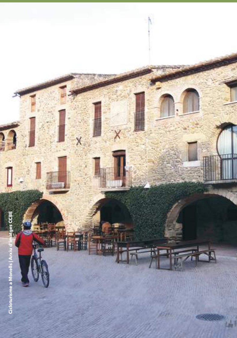
Cicloturisme a Monells